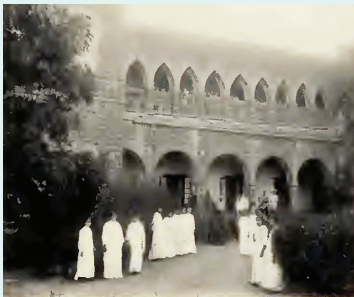
FRONT OF HOSPITAL AND INDIAN STAFF